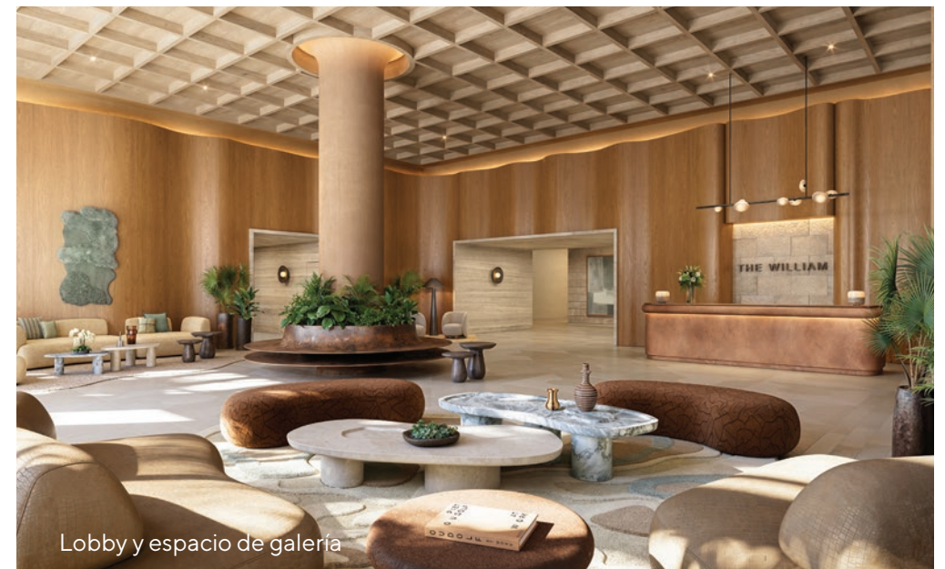
Lobby y espacio de galería