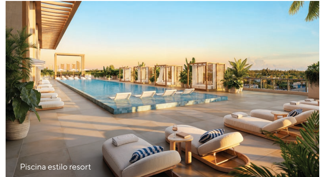
Piscina estilo resort