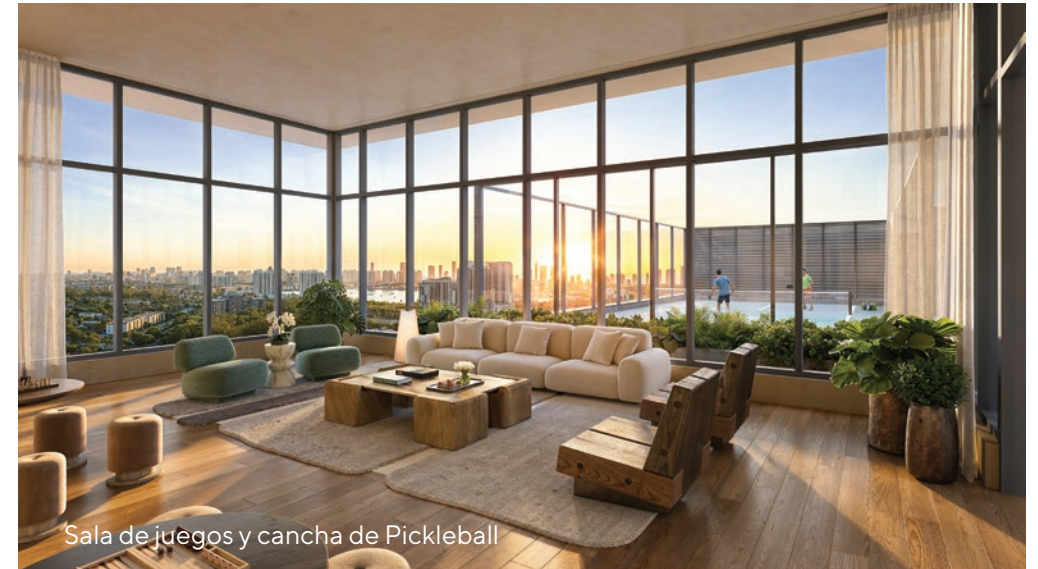
Sala de juegos y cancha de Pickleball