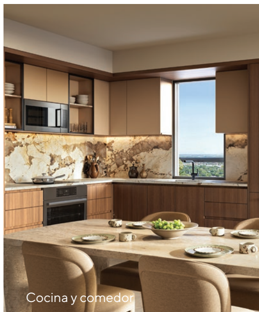
Cocina y comedor